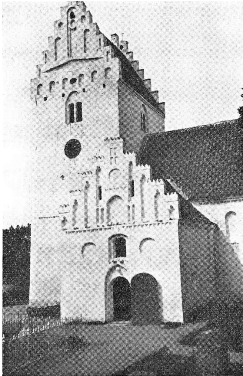
St. Olai kirke i Øster Egesborg.

ved noget om her i Sydsjælland, fejret på den store gård i Skovhuse. I tider, hvor man med rette kunne sige, at „Barselsengen var Kvindens Valplads“, hvor virkelig læge-