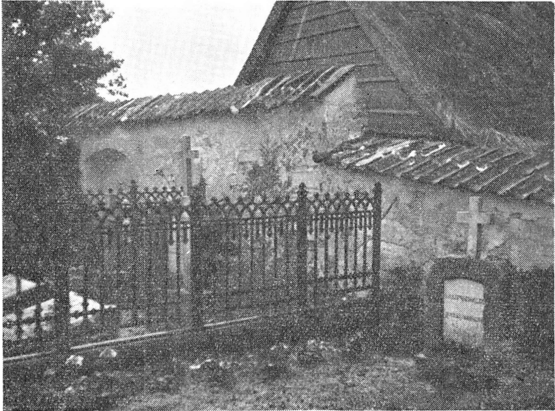
Gamle grave ved Øster Egesborg kirkegårds vestre mur.

borg kirkes midtergang, og selv om mange generationers tråd som sagt har slidt den ned til ulæselighed, vil den dog fremover bevare mindet om Sydsjællands mest ansete rytterbonde og om det afholdte ægtepar i Skovhuse.